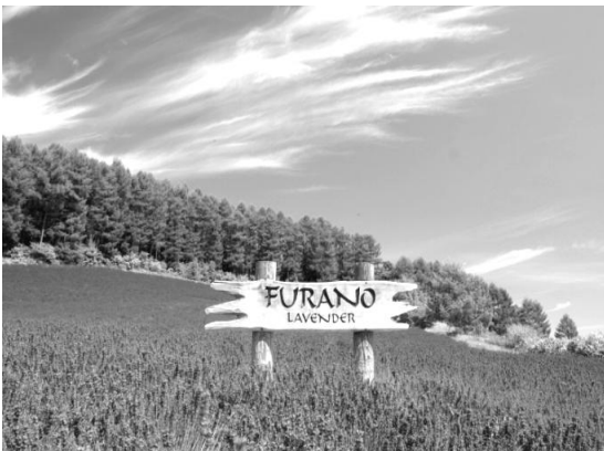
와인 하우스 라벤더