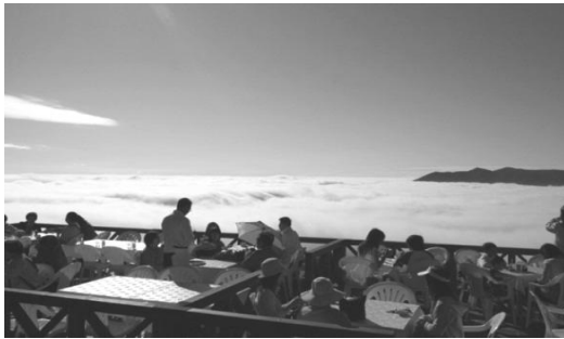
구름(시무캣뿌무라 관광 협회 HP)