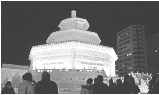
삿포로 눈축제